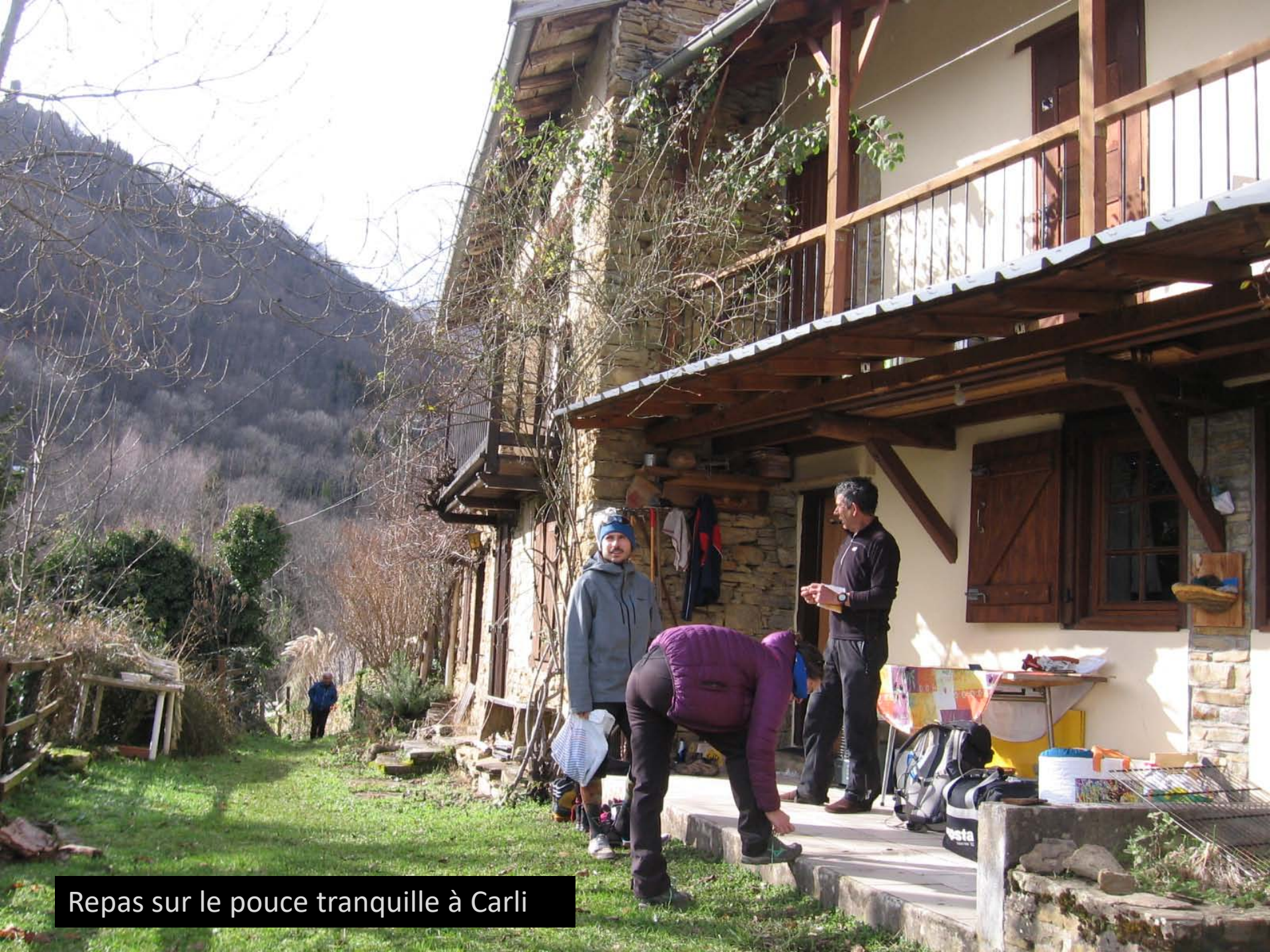
Repas sur le pouce tranquille à Carli